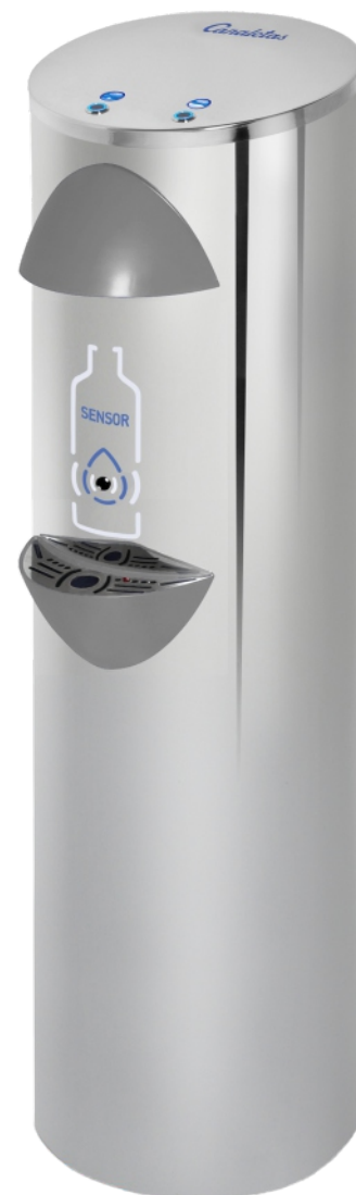
* color gris bajo pedido

BOTELLAS REUTILIZABLES : Botellas reutilizables 500 ml.