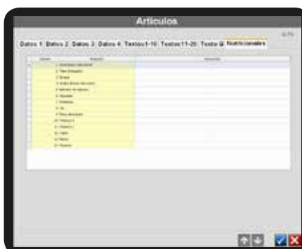
Gestión de artículos. Pantalla para grabación de los valores nutricionales de un artículo.