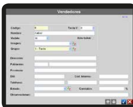
Gestión de plantilla. Pantalla para alta de nuevos vendedores.

Nota: La adquisición de licencias software permite la actualización de nuevas versiones a través de la web Dibal.