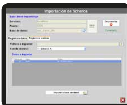
Gestión de ventas. Pantalla para importar ficheros de venta de una balanza a una BB.DD. para su posterior tratamiento.