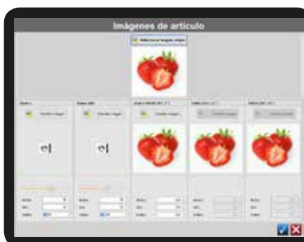
Gestión de imágenes de artículos y publicidad. Pantalla para asociar una imagen a un artículo.