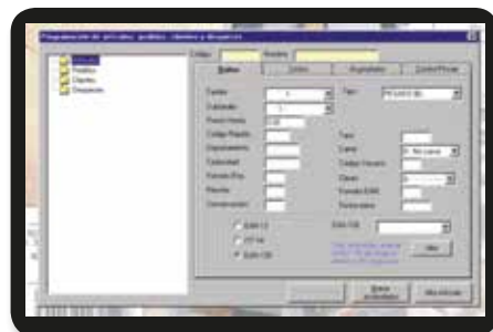
Gestión de artículos, pedidos, clientes y despieces. Pantalla de alta de artículos.