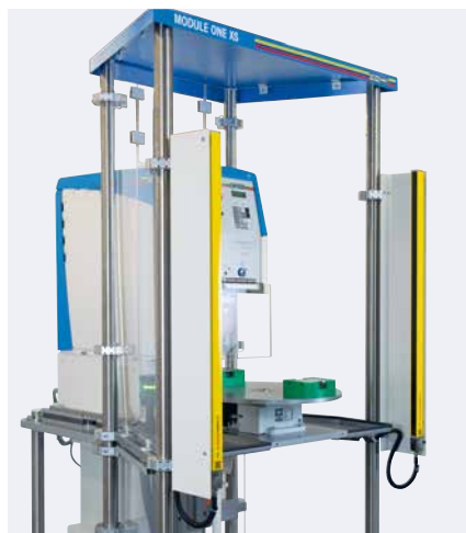
Barrera de luz, plato rotativo, mesa angular

El MODULE ONE XS se utiliza allí donde son prioritarias la seguridad y una producción