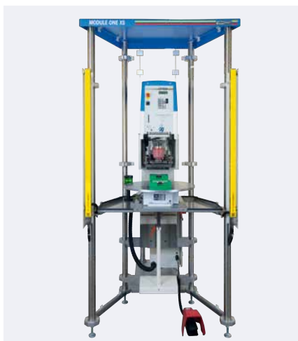
MODULE ONE XS con máquina de tampografía HERMETIC 9-12-universal

El MODULE ONE XS consta básicamente de un bastidor compacto, una carcasa protectora, así como los cuatro componentes estandarizados: plato rotativo, barrera de luz, mesa angular y soporte en cruz. La máquina de tampografía se configura de manera individual a partir de las series HERMETIC, SEALED INK CUP E y V-DUO.