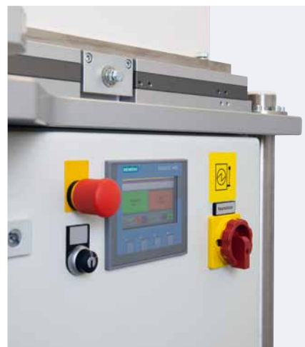
Panel táctil para manejar el plato rotativo

Junto con la práctica bandeja, la mesa angular de altura regulable facilita la impresión de piezas de distintas alturas. La barrera de luz garantiza una inserción segura de la mano en el plato rotativo.