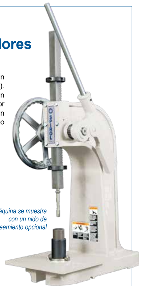
La máquina se muestra con un nido de alineamiento opcional

Se puede utilizar con todas las Boquillas de Inserción SPIROL: CXA, CXD