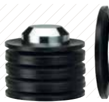
Resortes de Platillo