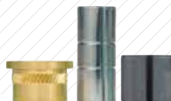
Limitadores de Compresión