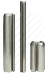
Pasadores Elásticos Ranurados