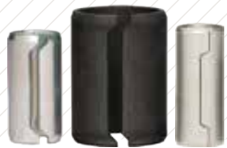
Camisas / Bujes de Alineación