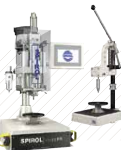
Tecnología de Instalación de Pasadores