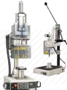
Tecnología de Instalación de Insertos