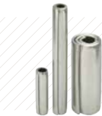
Pasadores Elásticos en Espiral