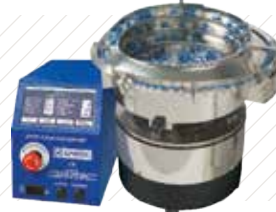
Sistemas de Alimentación Vibratoria