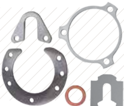
Precision Shims & Thin Metal Stampings