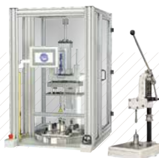
Tecnología de Instalación de Limitadores de Compresión

Para conocer las especificaciones actualizadas y la gama de producto estándar consulte www.SPIROL.es