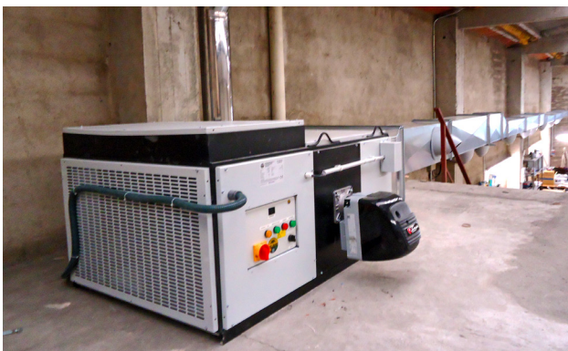
Instalación de un equipo MM-H en una nave industrial. Installation of a MM-H machine in a industrial area. Installation d'une équipe MM-H dans une engin industrielle

Installation example / Exemple de montage