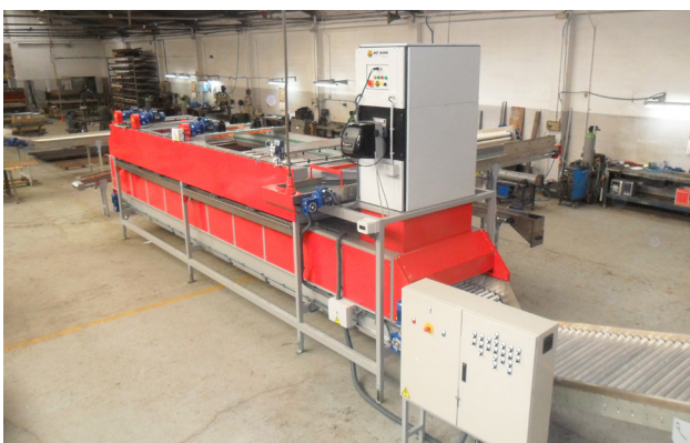
Instalación de un equipo en un proceso de secado poscosecha. Installation of a MM machine in a post-harvest drying process. Installation d'une équipe MM dans processus de séchage après récolte.