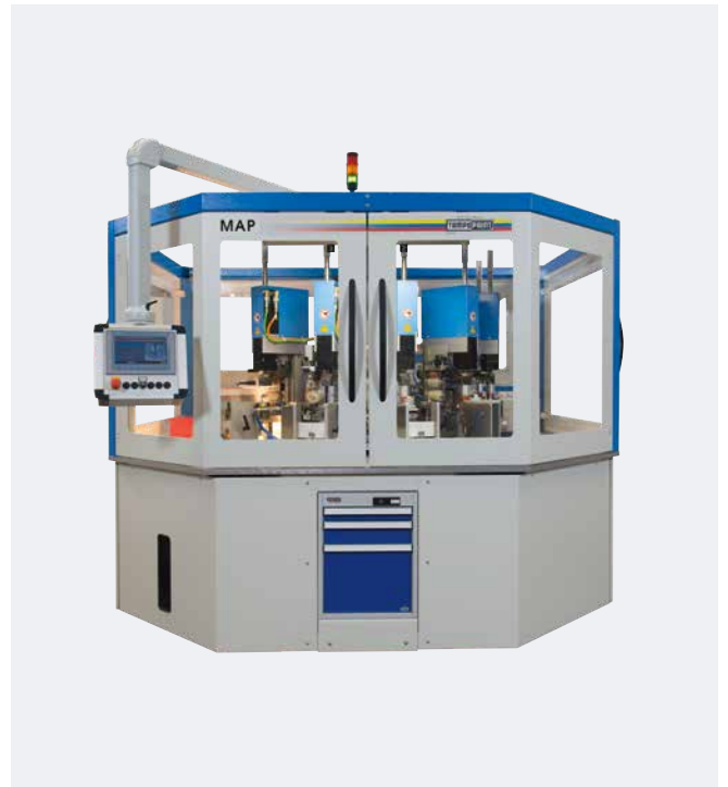
Automatización MAP Strip de monodosis