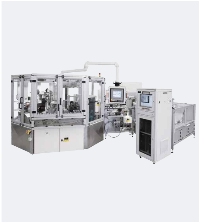
Automatización Tampografía rotativa Plumas de insulina

Construcción de maquinaria "Made in Germany", apoyada por un equipo altamente cualificado en los departamentos de ventas, proyectos, ingeniería así como servicios de pre y post-venta que garantizarán la realización profesional desde el concepto a la producción de 24 horas para nuestros clientes.