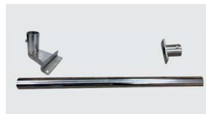
> Kit columna de acero inoxidable para indicadores DMI-610 Inox y DMI-620, y Cely VC-80 I