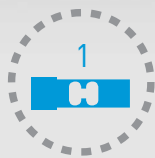
1 CÉLULA DE CARGA