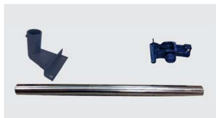
> Kit columna de hierro para indicadores DMI-610 BASIC ABS y DMI-610 ABS