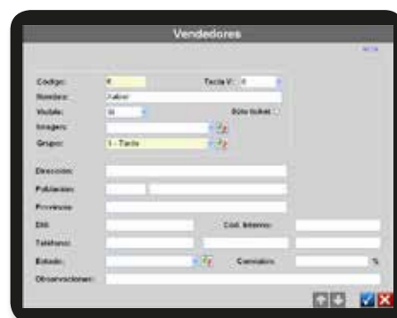
Gestión de plantilla. Pantalla para alta de nuevos vendedores.

Nota: La adquisición de licencias software permite la actualización de nuevas versiones a través de la web Dibal.