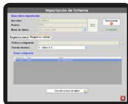
Gestión de ventas. Pantalla para importar ficheros de venta de una etiquetadora a una BB.DD. para su posterior tratamiento.