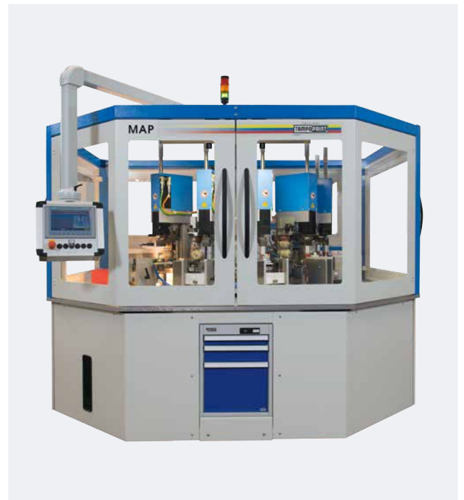
Automatización MAP Montaje variable