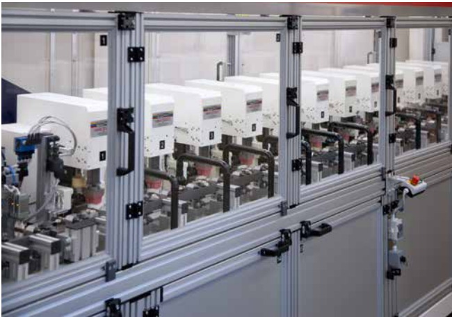
12x RAPID 2000/1 Automatización lineal