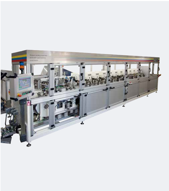
Automatización para 12 colores con RAPID 2000/1