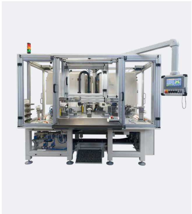
Automatización para 4 colores con HERMETIC 13-12 universal