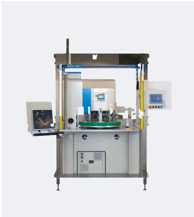
Automatización MODULE ONE S Impresión en 2 colores

Construcción de máquinas – simplemente "Made in Germany".